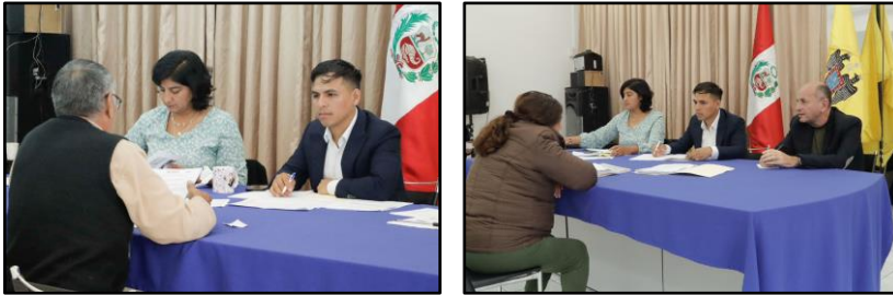
Agencia Municipal de Salamanca

Se realizaron Audiencias con los vecinos y nuestro Alcalde en las Agencias Municipales